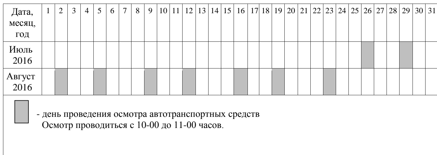
ГРАФИК ПРОВЕДЕНИЯ ОСМОТРА АВТОТРАНСПОРТНЫХ СРЕДСТВ